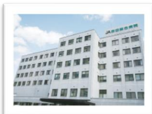
JA 吉田総合病院 (安芸高田市吉田町)