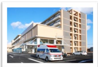
JA 尾道総合病院 (尾道市平原台)