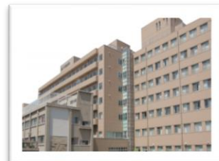
JA 広島総合病院 (廿日市市地御前)