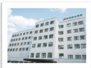
JA 吉田総合病院 (安芸高田市吉田町)